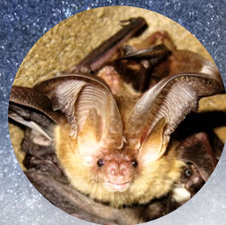
Braunes Langohr und Haselmaus sind besonders lichtempfindlich.