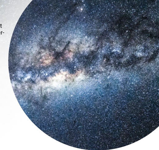
Die Milchstraße ist wegen der Lichtverschmutzung fast nirgendwo mehr zu sehen.